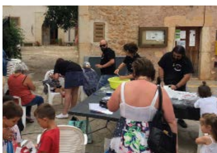
Taller de màscares de guix