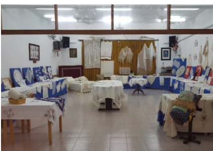
Exposició de brodats