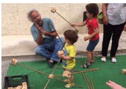
Jocs infantils al carrer a Biniali