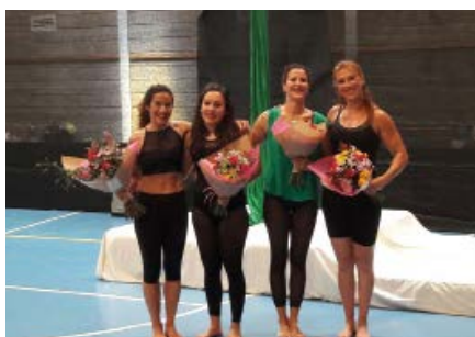
Exhibició dansa aèria