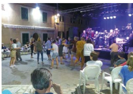
Concert i ball a Biniali