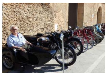
Exposició de motos antigues