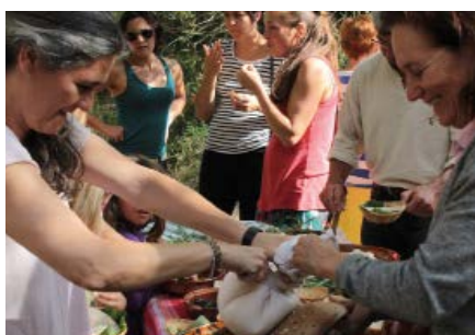
Taller de formatge i visita a la Cova del Camp del Bisbe