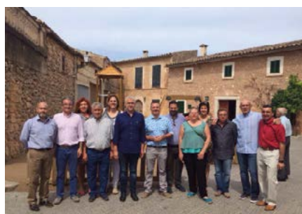
Inauguració Parc Infantil Biniali