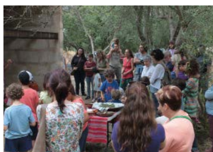
Taller de Formatge