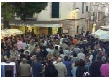
Espipella On Tour a Sencelles