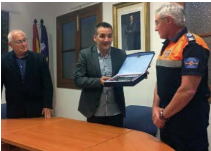
Homenatge a Protecció Civil

Aquí us deixem algunes de les instantànies que quedaran en la memòria.