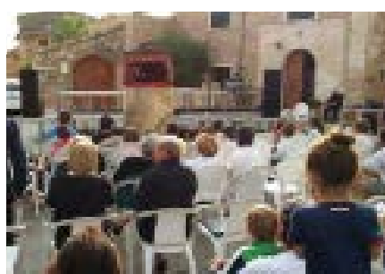
Espectacle de titelles